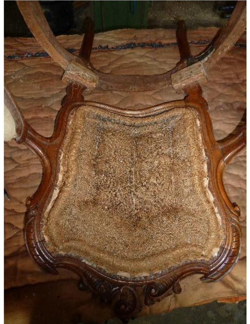
Beau travail côté dossier réalisé en plein avec une piqûre en crin animal