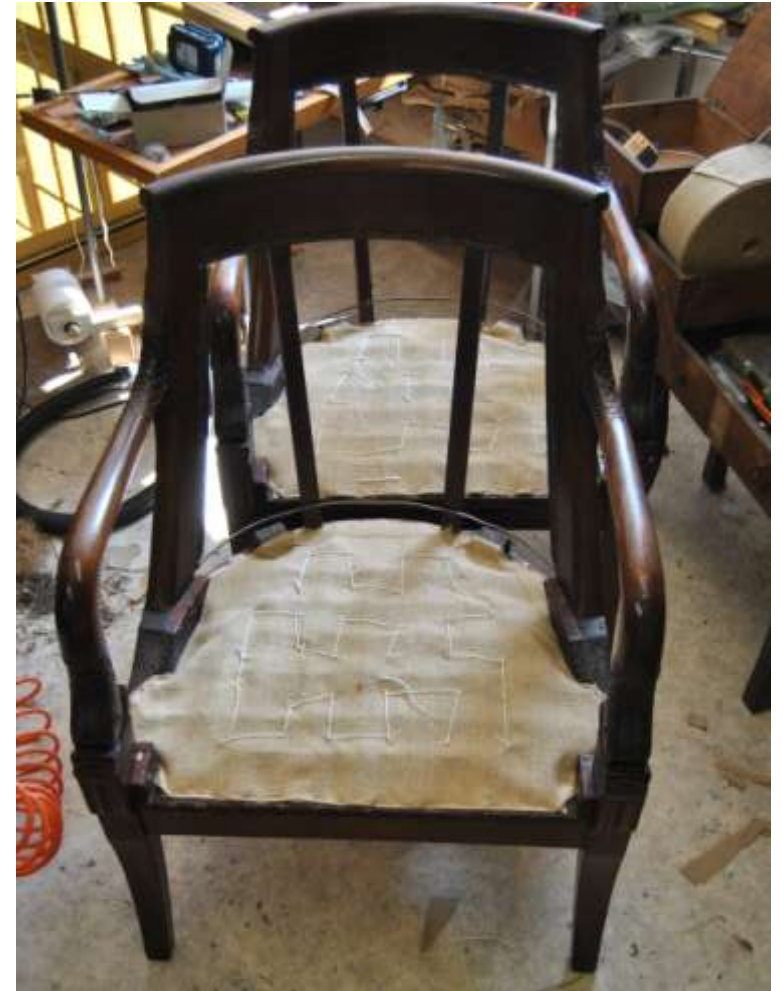
Les toiles fortes sont cousues sur les ressorts.